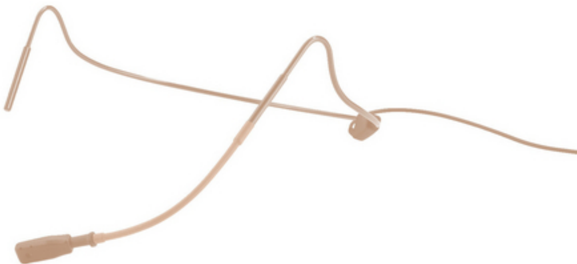
Umbau von 4-Pol-HSE-Kopfbügelmikrofonen zum Anschluss an JTS-Taschensender Reconfiguration of 4-pole HSE headband mics for the connection to JTS pocket transmitters